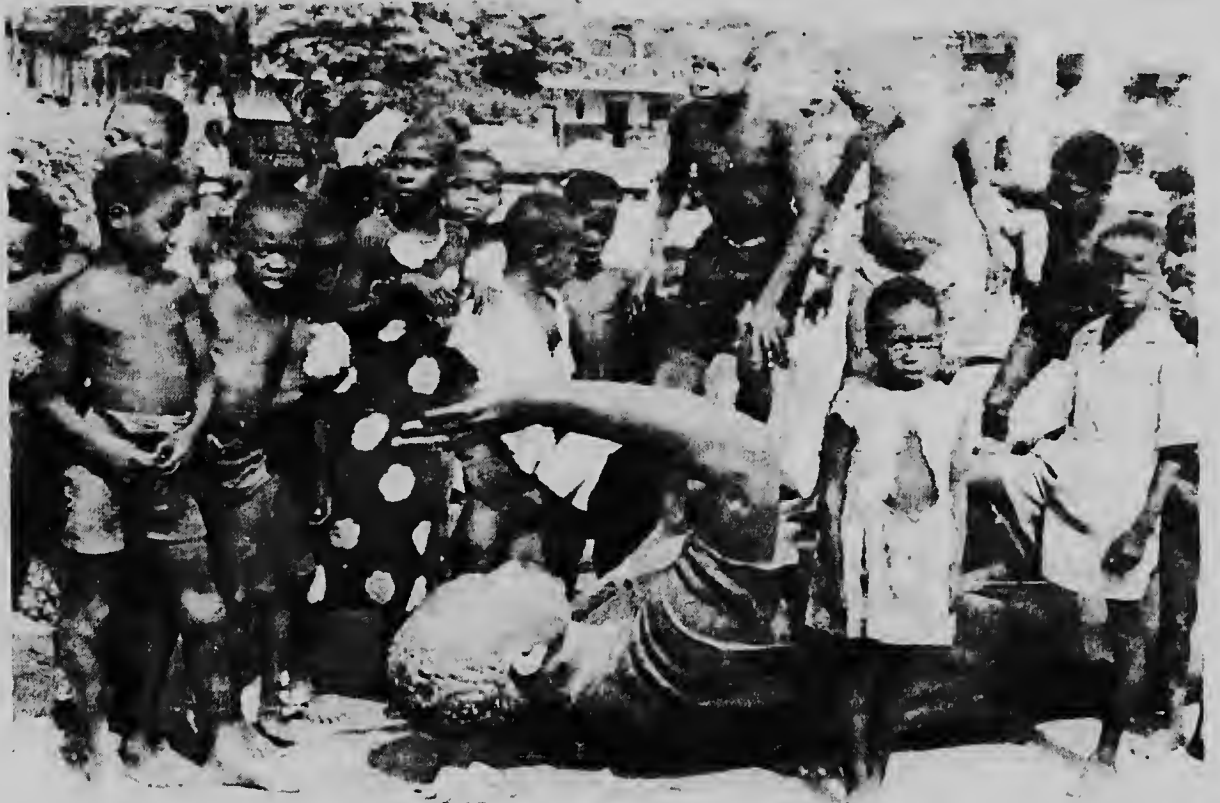
ACCRA--GHANA--Aki nos por mira algun muchu ta hungando riba e estatua di presidente derroca di Ghana Kwame Nkrumah. E estaua tabata den centro di Accra te cu siman pasa prome cu e golpi di estado.

Ankrah a declara cu estado Ghanes lo debilbe na empresarionan priva algun compania estatal icu e gobierno lo ocupe solamente cu e proyectonan fundamental pa e nacion. Nan a apoya competencia na beneficio dje economia nacional" Tam